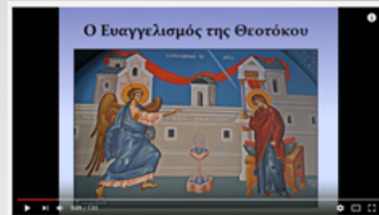
ΕΙΚΟΝΑ 1. ΕΥΑΓΓΕΛΙΣΜΟΣ ΘΕΟΤΟΚΟΥ