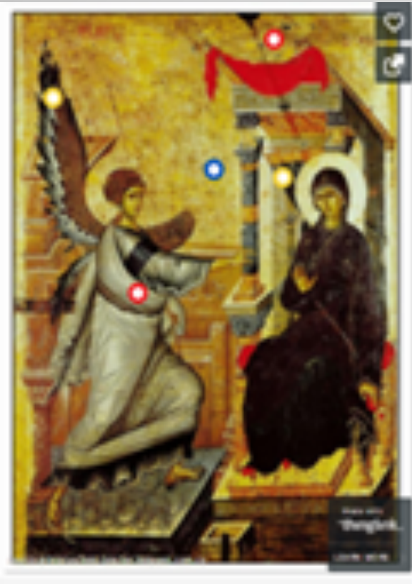
ΕΙΚΟΝΑ 2. ΕΥΑΓΓΕΛΙΣΜΟΣ

( http://primaryschool-teacher.blogspot.gr/search?updated-max=2016-10-31T00%3A00%3A00%2B08%3A00&max-results=10 )