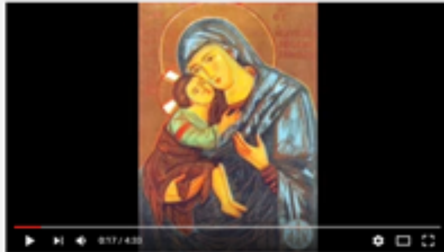
Τα ονόματα της Παναγίας

( https://www.youtube.com/watch?v=RncjnlmriZs )