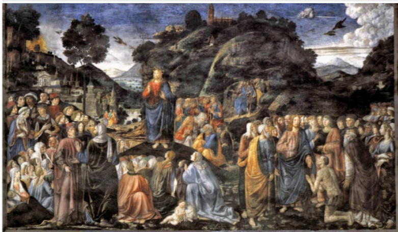
Cosimo Rosselli 1481 – 1482, The sermon on the mountain fresco on the northern wall of the Sistine Chapel, Vatican City

ὄσιν δε τους ἀχλους ἀνέβη εις το ὄρος, και καθίσαντος Αυτοῦ προσήλθον αὐτῷ οι μαθηταὶ Αυτοῦ, και ανοίξας το στόμα Αυτοῦ εδίδασκεν αὐτούς ἑγνων” Mt 5, 1-2