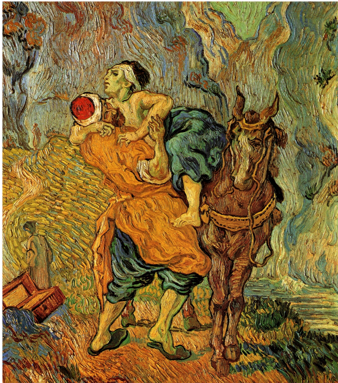
The Good Samaritan, Vincent van Gogh, 1890, Netherlands