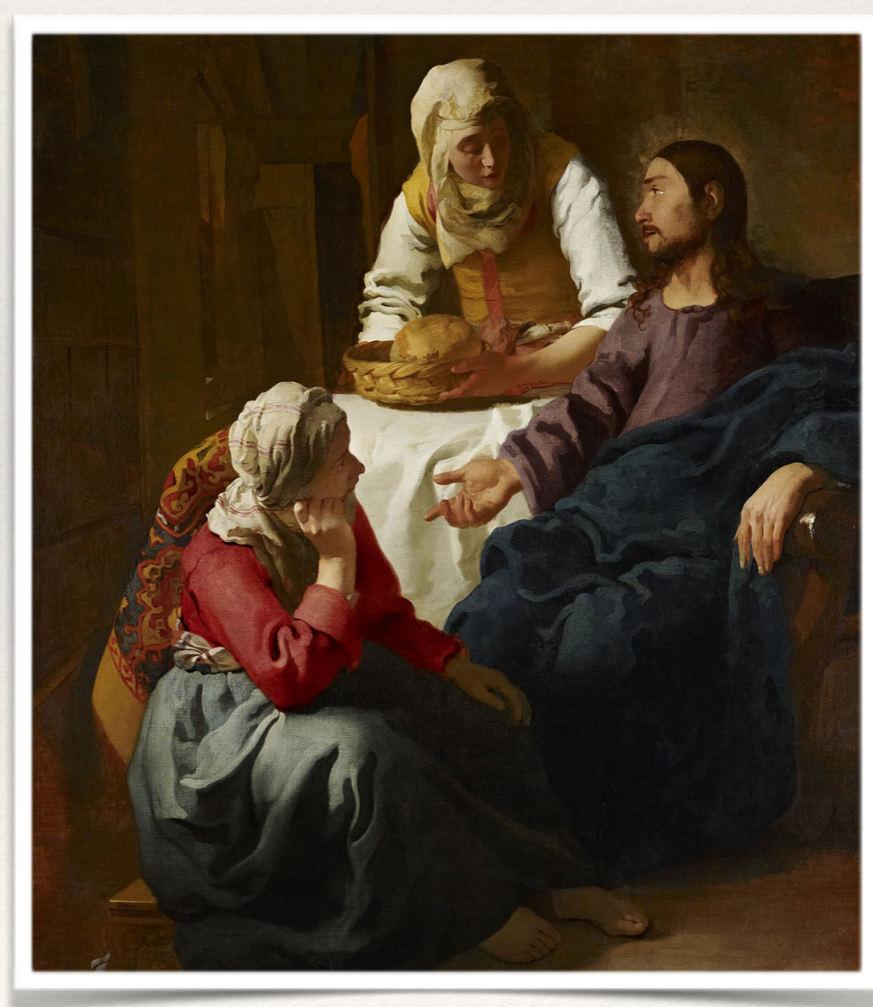
Ο Ιησούς με μαθήτριες Γιαν Βερμέερ, 17ος αι