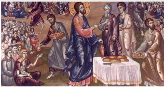
Ο χορσασμός τῶν πέντε χιλιάδων