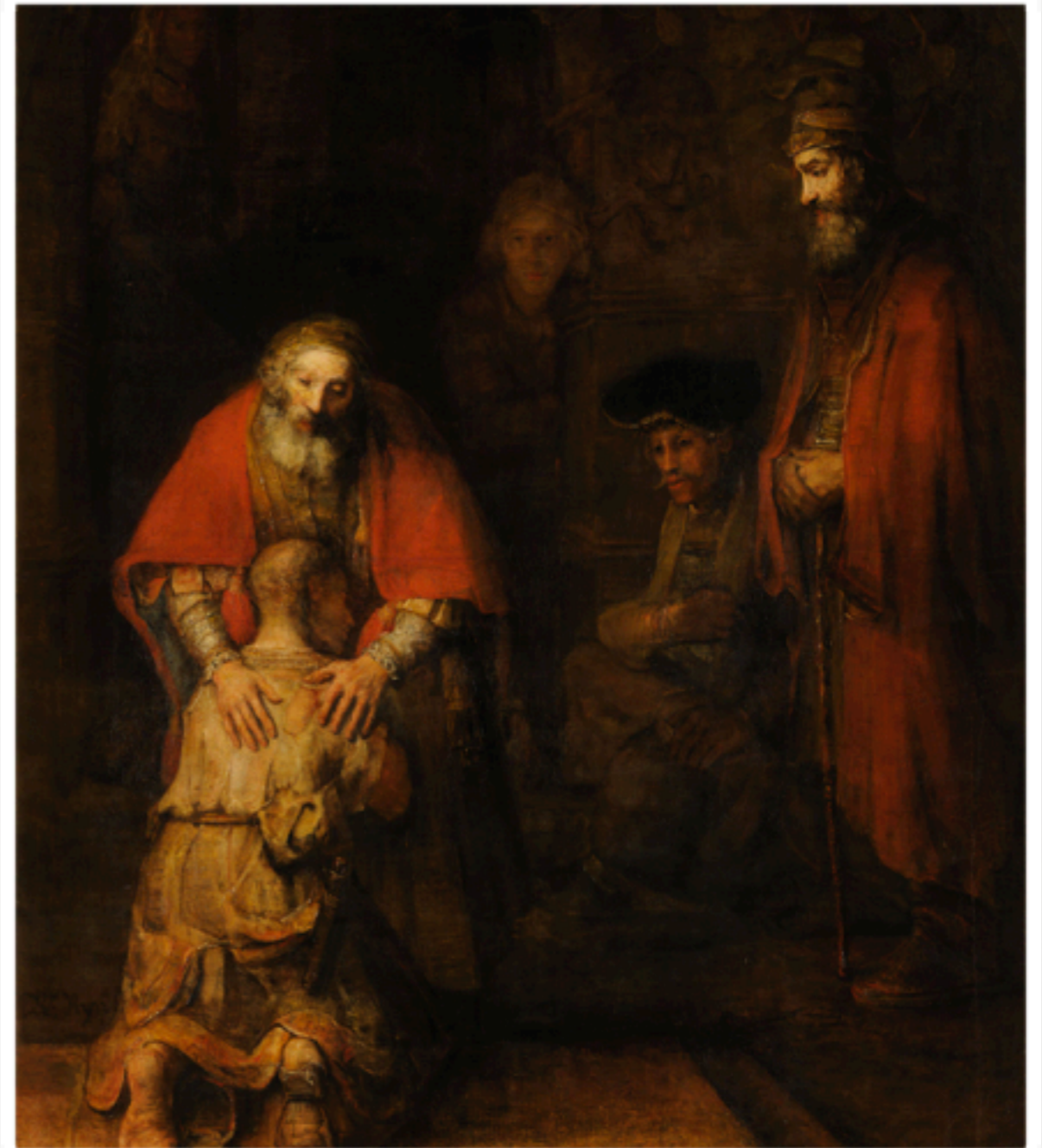
Η επιστροφή του ασώτου, Ρέμπραντ, 1668-9, Μουσείο Ερμιτάζ