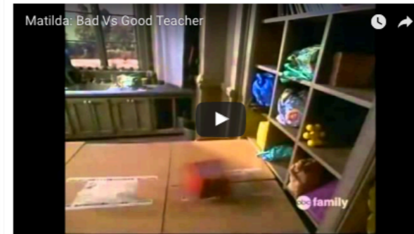
Συγκρίνω, συζητώ, σχολιάζω.

Σκέψεις, γνώμες, ιδέες, συναισθήματα και προσδοκίες από δάσκαλους.